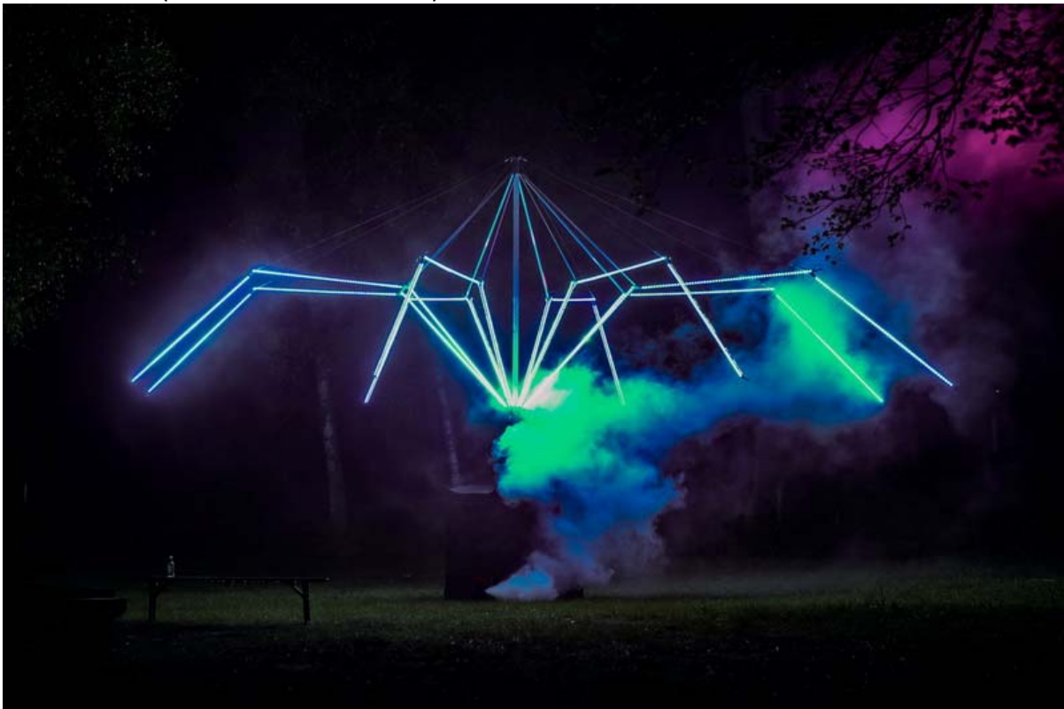
Festival 2019 (Kunstwerk 'Oumua' AT)