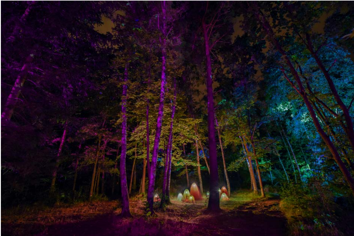
Lichtstimmung Festival 2020 (Kunstwerk 'Underworld' SE/AR)