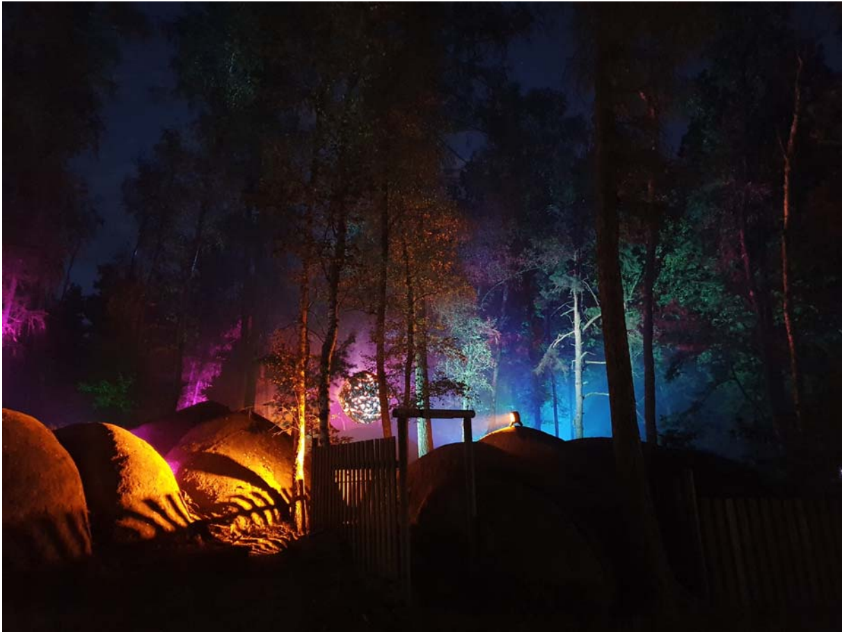
Lichtstimmung Festival 2020 (im Hintergrund: Kunstwerk 'Anima' SLO)

(für vollständigen Einblick siehe Pressebilder, bzw. Homepage)