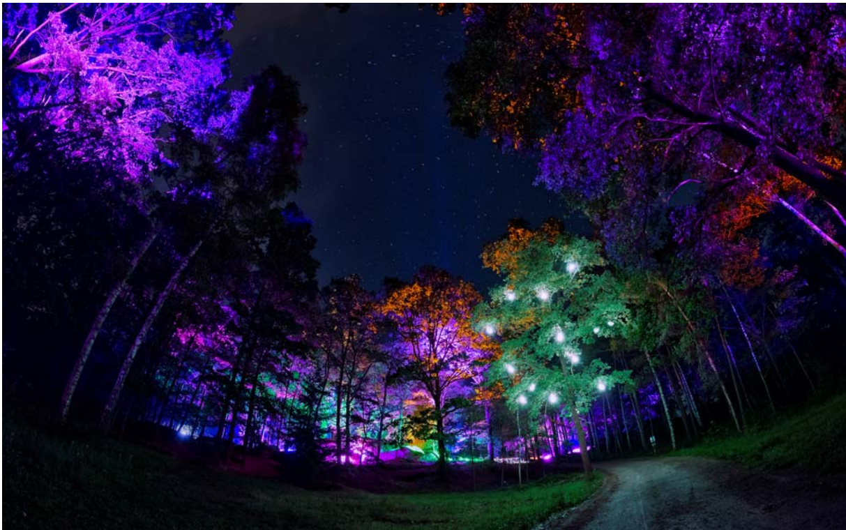
Lichtstimmung Festival 2018 (auch zu sehen: Kunstwerk 'Lumiseeds' AT)