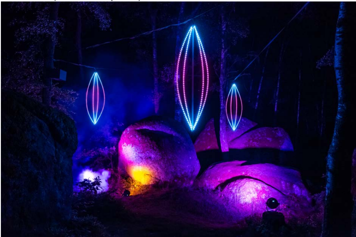
Festival 2018 (Kunstwerk 'Pupas' AT)